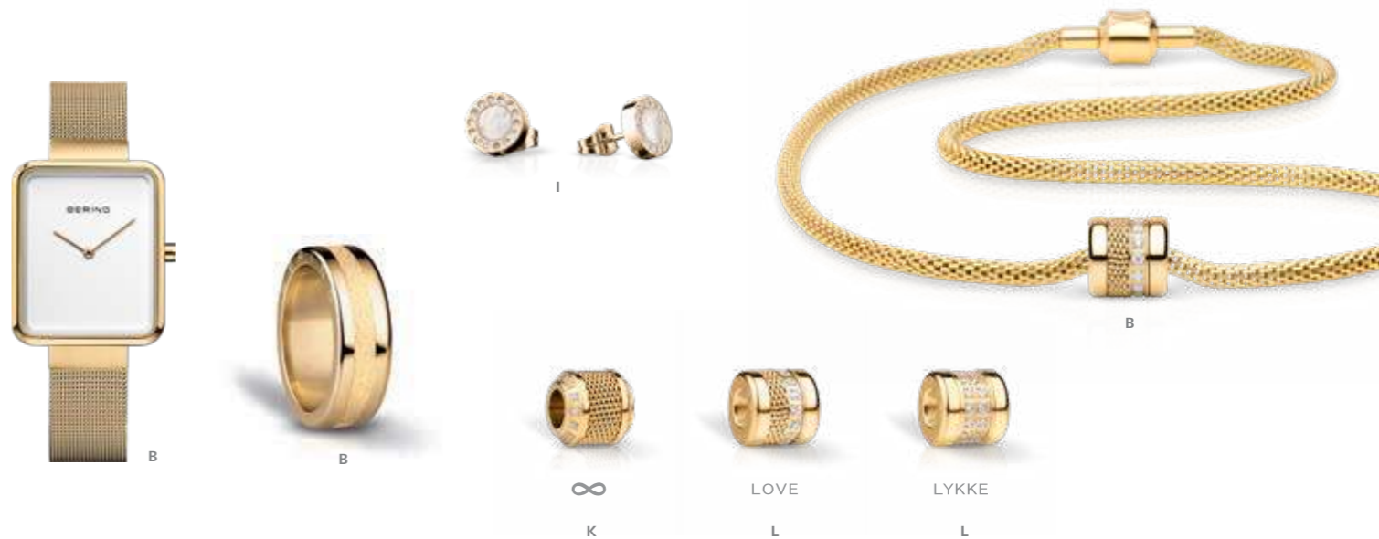
A. Uhr SOLAR: 14631-307, €179,- | B. Uhr: 10817-307, €189,- | C. Uhr mit Keramik-Lünette: 11435-387, €169,- | D. Uhr: 14539-307, €189,- E. Ohrstecker mit Hightech-Keramik: 701-17-05, €29,90 | F. Uhr: 16540-308, €149,- | G. Uhr: 10128-368, €179,-

Das Design-Highlight in Schwarz veredelt jedes Outfit. Schwarze Hightech-Keramik oder anschmiegsames Milanaise werden kombiniert mit roségoldfarbenem Edelstahl oder SWAROVSKI ELEMENTS.