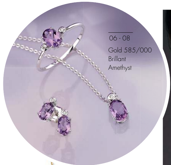
06-08 Gold 585/000 Brillant Amethyst