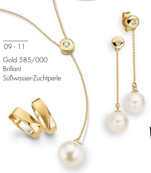
09-11 Gold 585/000 Brillant Süßwasser-Zuchtperle