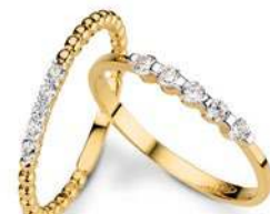
19 20 Zirkonia*