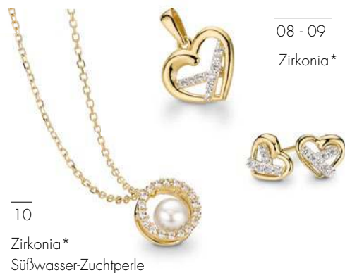
10 Zirkonia* Süßwasser-Zuchtperle

Hier dürfen Sie sich gern einloggen, wenn Sie sich mit den heißesten Kreationen aus der CEM Gold-Kollektion vernetzen wollen. Bestens verarbeitet, mit Zirkonia, Perlen oder Farbsteinen, lässt sie keine Wünsche offen. Und keine Sorge, diese Verbindung ist qualitätsstabil. Bleiben Sie dran.