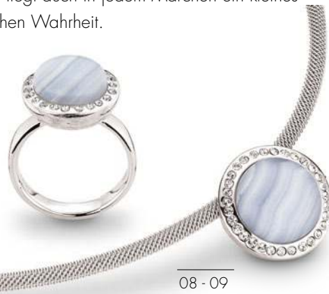
08-09 Chalcedon Zirkonia*