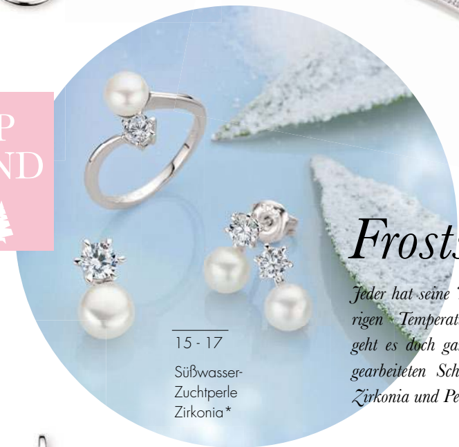
15 - 17 Süßwasser- Zuchtperle Zirkonia*