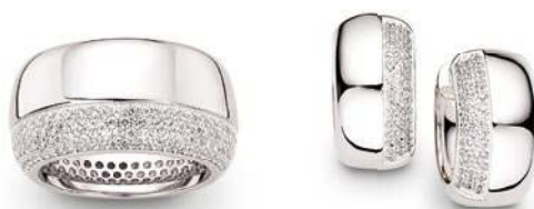
01-02 PR8656B Armband 18 + 3 cm 69,90 | PR8656C Collier 42 + 3 cm 149,00 | 03-04 PR86570 Ohrstecker 49,90 | PR8657A Anhänger 36,00 | 05-06 PR8658R Ring 119,00 | PR8658O Creolen 109,00