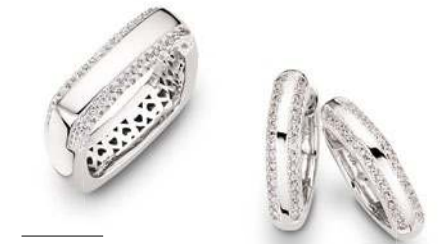
12 - 14 Zirkonia*