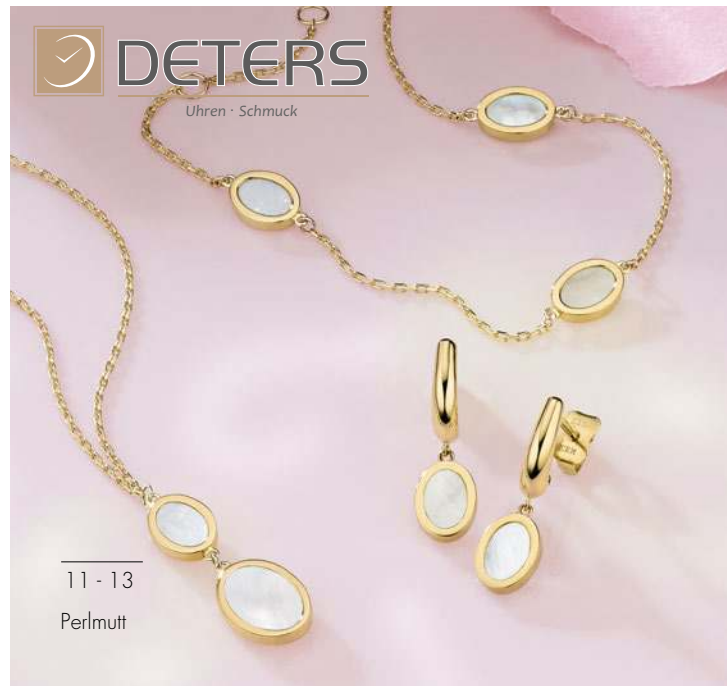
11 - 13 Perlmutter