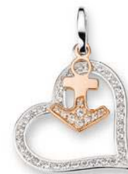
18 - 19 Zirkonia* rosévergoldet

Jeder hat seine Tricks, um sich vor niedrigen Temperaturen zu schützen. Dabei geht es doch ganz einfach mit den zart gearbeiteten Schmuckstücken aus Silber, Zirkonia und Perlen von CEM.