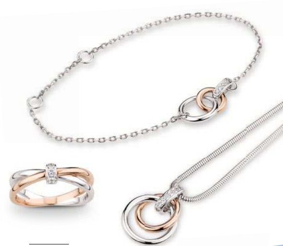
09 - 11 Zirkonia* rosévergoldet

„In jeder Frau steckt eine Heldin!“ – kühne Behauptung, Wunschenken oder doch Realität? Die Antwort liegt in Ihnen selbst. Aber seien Sie sich gewiss, Heldentum hat nichts, aber auch gar nichts mit rücksichtslosem Draufgängertum gemein. Emotionen gehören unbedingt dazu. Auch bei Eiskälte gewinnen Sie mit femininer Wärme und Empathie. Ganz wie CEM.