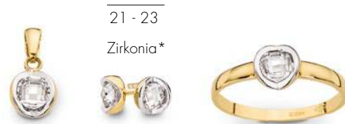
21 - 23 Zirkonia*

Sind Schmuck und Uhren nicht auch immer der Ausdruck Ihrer Persönlichkeit? Wir bieten Ihnen eine große Auswahl und finden gemeinsam mit Ihnen Ihr neues Lieblingsstück.