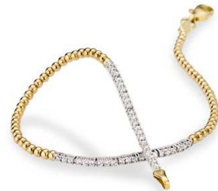
17 - 18 Zirkonia*