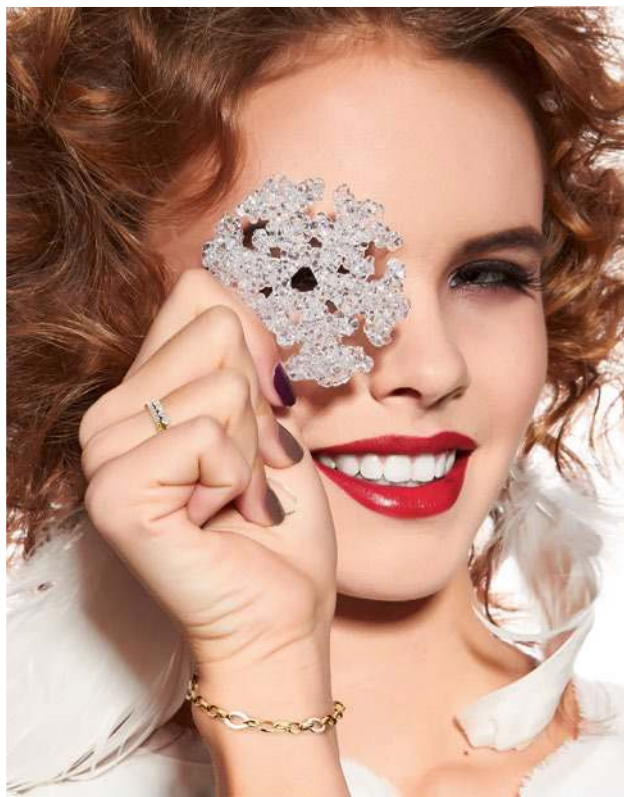
01 - 03 Saphir