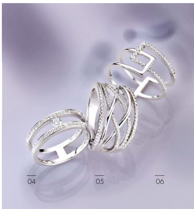
04 05 06

01-03 PR8624O Ohrstecker 149,00 | PR8624C Collier 42 + 5 cm 109,00 | PR8624R Ring 99,00 04 PR8626R Ring Zirkonia* 59,90 05 PR8627R Ring Zirkonia* 109,00 06 PR8628R Ring Zirkonia* 79,90 07 PR8625C Collier 42 + 3 cm 2rhg. Zirkonia* 49,90