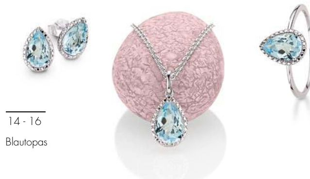
14 - 16 Blautopas

Kann Schmuck emotional sein? Wir meinen Ja. Spüren Sie es selbst, wie sich Ihr Lieblingsstück auf Ihr Wohlgefühl auswirkt und Ihnen Wärme vermittelt. Wir haben ein paar Testkandidaten aus der CEM Gold-Kollektion für Sie vorbereitet.