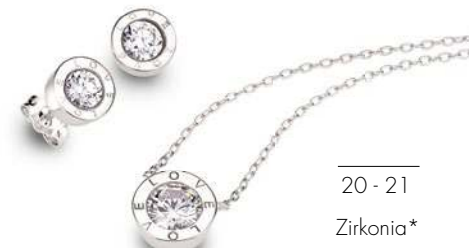
20 - 21 Zirkonia*

08 PR8630A Anhänger Zirkonia* 39,90 09-11 PR8629B Armband 17 + 2 cm 79,90 | PR8629R Ring 99,00 | PR8629A Anhänger o. Kette 59,90 12-14 PR8631R Ring 129,00 | PR 8631O Creolen 99,00 | PR8632B Armband 17 + 2 cm 79,90 15-17 PR8633R Ring 49,90 | PR8633A Anhänger 39,90 | PR8633O Ohrstecker 49,90 18-19 PR8634A Anhänger Herz 99,00 | PR8635A Anhänger Kreuz 69,90 20-21 PR8636O Ohrstecker 39,90 | PR8636C Collier 42 + 3 cm 49,90